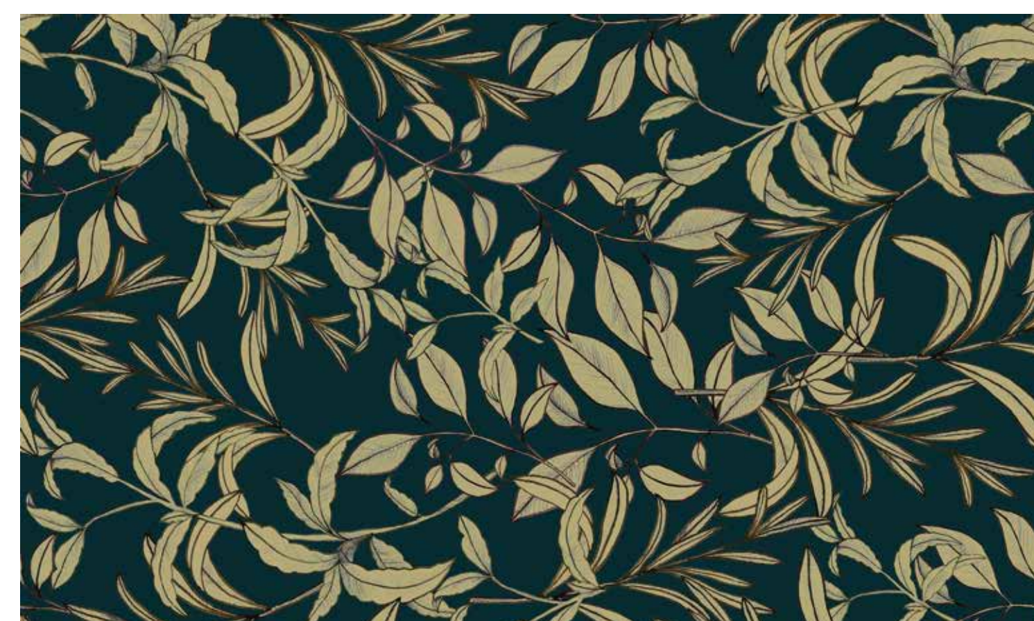
Texture · Foglie d'oro · by INKIOSTRO BIANCO