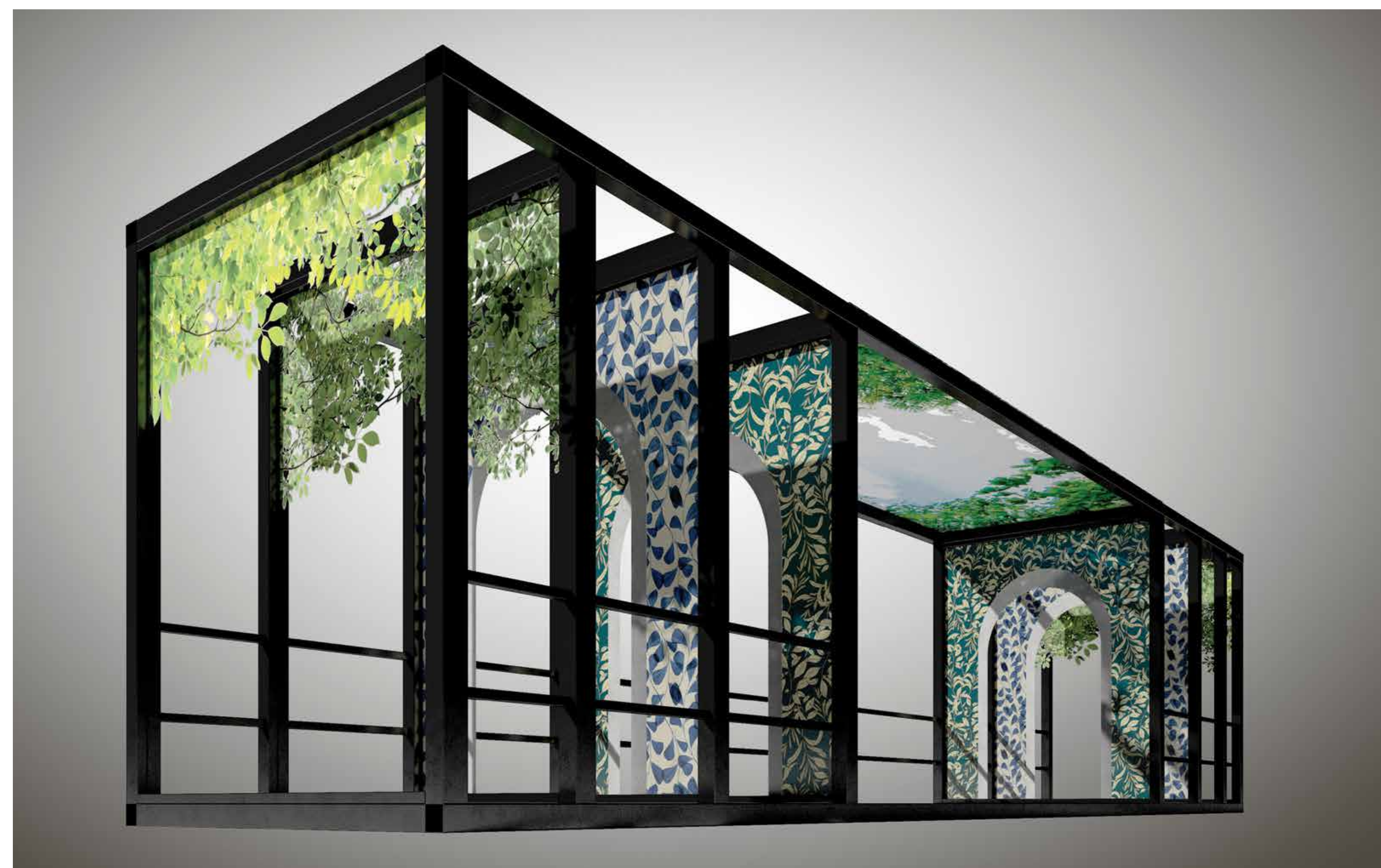
Installation · FUTURE DEHOR PRINT · print on glass · by FERRO and VENETO VETRO